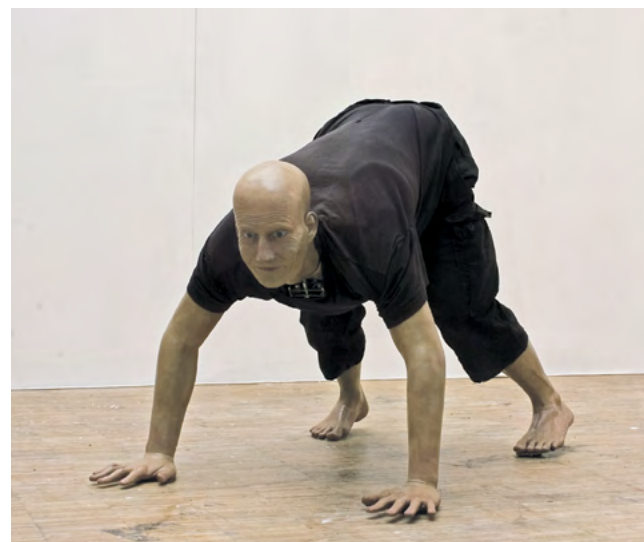
»autonomer«, 2011, diverse Materialien, 85 x 130 x 85 cm