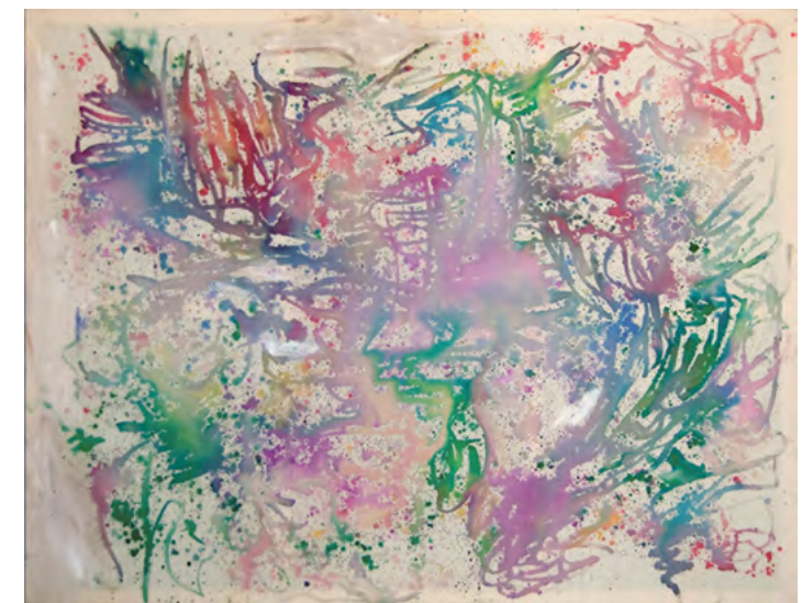
»Aquarell No. 2«, 2016, Aquarell auf Leinwand, 155 x 200 cm

2016 »Mimikry«, Kabakon Art House, Leipzig »how hard can it be«, Galerie Gebr. Lehmann, Dresden 2015 »shots«, dst-galerie, Münster 2014 »Building Building – Utrecht-Dresden-Exchange-Project«, das Spectrum, Utrecht / das Areal/Lab15, Dresden