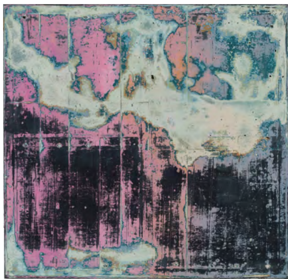
a. T. (C.5-9)«, 2014, Öl auf Leinwand, 115 x 120 cm

2015 DELTA – Espacio Galerie, London 2014 KARAWANE - Kunstraum Kreuzberg/Bethanien, Berlin 2013 Verbotene Ägyptologie zu verschenken oder gegen 1-2 Flaschen Bier zu tauschen - FRIDAY EXIT, Wien 2012 Mild at Heart - Galleria Maniero, Rom