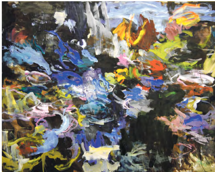
W. Seifert: »Jurassic Park«, 2015, Öl auf Leinwand, 155 x 200 cm