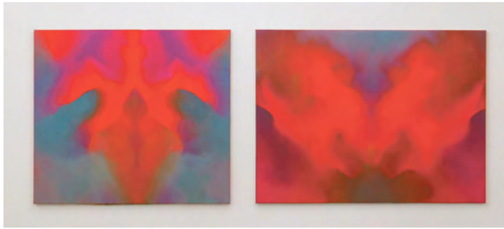
ohne Titel, 2015, Öl auf Leinwand, links: 150 x 170; rechts: 150 x 200 cm.