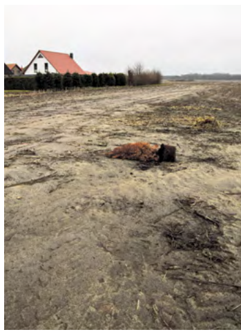
K. Berndt: »Am Feldrand«, 2014, Inkjet-Print auf Kapafix, 100 x 74 cm