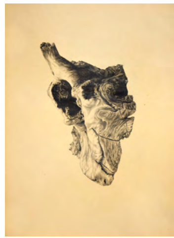
M. Athenstaedt: »Baumstumpf«, 2015, Bleistift auf Papier, 40 x 30 cm