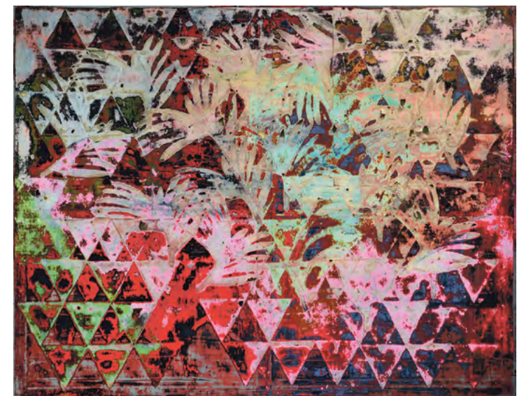
S. Hoppe: »Matisse is calling. (2)«, 2015, Öl auf Leinwand, 110 x 140 cm