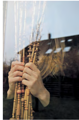
»Hinter Glas«, Inkjet-Print auf Alu-Dibond, 2012, 150 x 99,5 cm

2015 Kreuzigungen – Meisterschüler in Dialogen mit Beckmann, Corinth, Dali, Slevogt und Hrdlicka, Sakralmuseum St. Annen, Kamenz (G, Kat.) 2014 Monitoring 2014 – eine Ausstellung zwischen Dystopien und Ordnungssystemen, Kasseler Kunstverein, Fridericianum, Kassel (G, Kat.) 2012 Keine Bilder ohne Liebe, Galerie Poll, Berlin (G, Kat.)